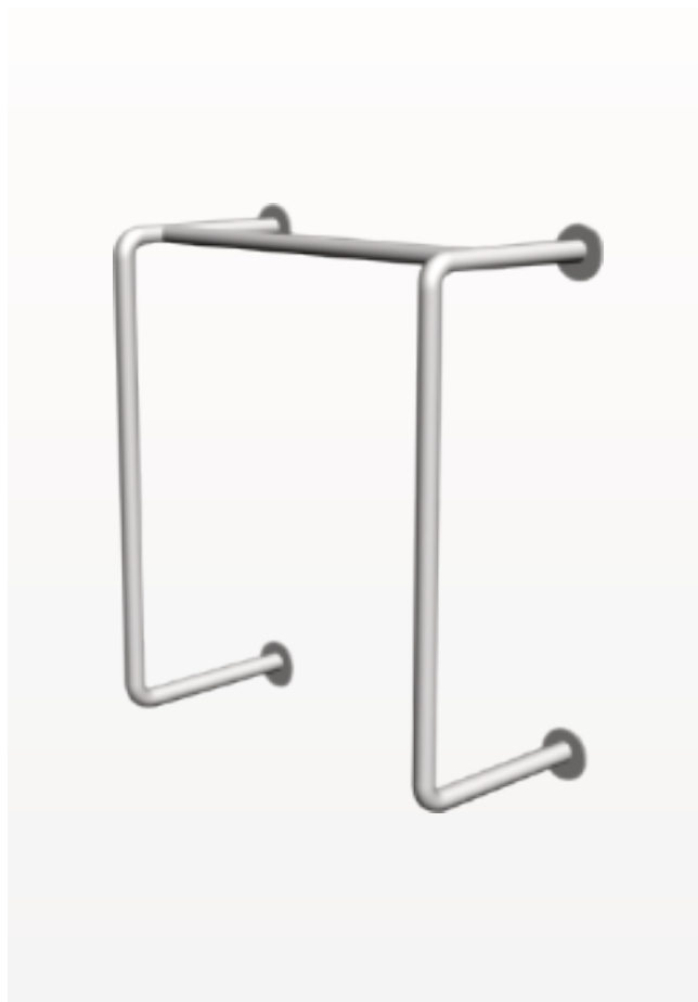
Barra de seguridad