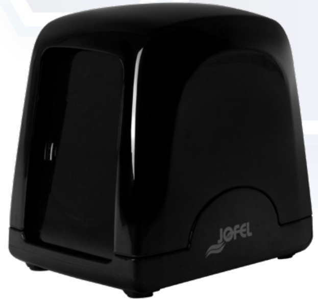
ESQUEMA DE PRODUCTO: