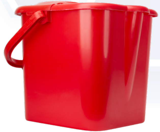
ESQUEMA DE PRODUCTO: