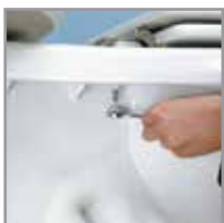
Desprenda la parte inferior del perno.