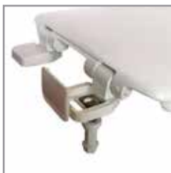
Bisagra Ajustable con sistema Permajuste™