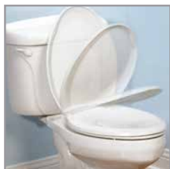
Acción de Cierre Lento en tapa y anillo.