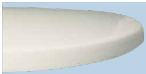
Diseño innovador que integra asiento y tapa en un solo elemento.