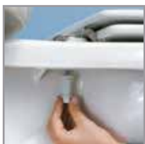
Ajuste la tuerca.