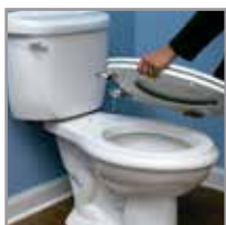
Instale el asiento en el sanitario.